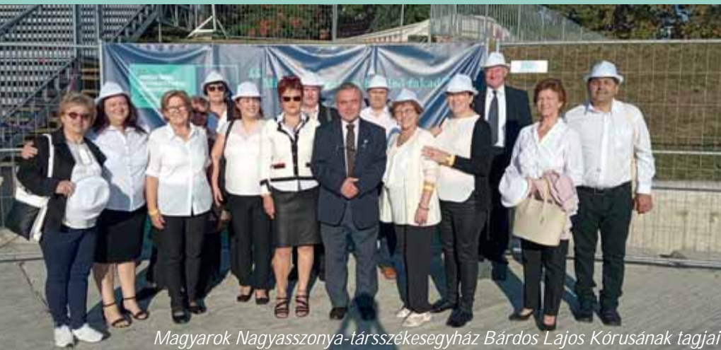
Magyarok Nagyasszonya-társzékesegeyház Bárdos Lajos Kórusának tagjai

sznyi bíborosról, akinek boldoggá avatása éppen ezekben az órákban történik Varsóban. Nagy szeretettel őrizzük Isten Tiszteletreméltó Szolgája, Mindszenty József bíboros emlékét, aki a Krisztus iránti töretlen hűség példáját nyújtotta Egyházának és népének.