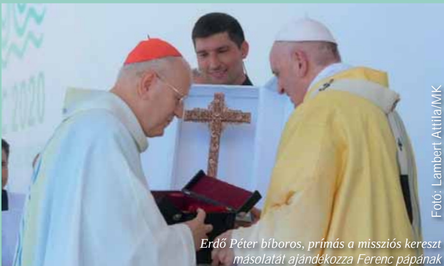
Erdő Péter bíboros, prímás a missziós kereszt másolatát ajándékozza Ferenc pápának

Sok áldás kísérté azt is, hogy a missziós kereszt bejárta Magyarországot és a környező országokat. Régióink boldogainak és szentjeinek ereklyéi ráébresztették lelkiismeretünket, hogy ma is megélhetjük az életszentséget, az elmúlt évszázad nagy vértanúinak és hitvallóinak nyomában. A már szentté avatott személyek mellett tisztelettel emlékezünk meg a nagy főpásztorokról, mint például Stefan Wy-