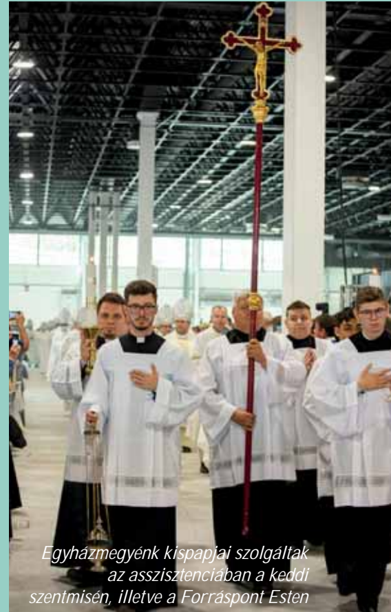
Egyházmegyénk kispapjai szolgáltak az asszisztenciában a keddi szentmisén, illetve a Forráspont Esten

Amikor minden nap magamhoz veszem az Eucharisziát a szentmisében, körbenézek, és azt látom, mindannyian ugyanazt a Krisztust vettük magunkhoz, tehát mi egyek vagyunk, így a mi lelki kapunk is feltárul, és teret engedek a dicsőség Királyának. Ha bevonul, megkérdezem magamtól, ki a dicsőség Királya, mi köze van az életemhez? A válasz a bizalom, és az, hogy egyszerűen benne van az én életemben. A megtérésemnél is az Eucharisziában találtam meg a bizalmat, most az Eucharisztikus Kongresszuson ez megerősödött bennem, és arra bátorít, hogy nehéz vagy örömteli körülmények között, a hétköznapokban is bízzak. Talán a szeretetnek a magasztos szintje az, hogy én bízhatok. Tapasztalom, hogy szeretni nehéz a gondterhelt időkben, bízni viszont könnyebb, és ez elvezet a szeretet-