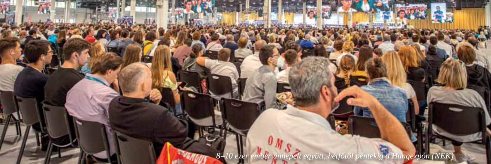
8–10 ezer ember ünnepelt együtt, hétfőtől péntekig a Hungexpón (NEK)

Életünkben vannak meghatározó élményt jelentő mérföldkövek, fordulópontok, amelyek mint forráshoz a visszatérés lehetőségét ajándékozzák, hogy abból újra-és újra meríthessünk. A Nemzetközi Eucharisztikus Kongresszus egy ilyen forrás lett az életünkben.