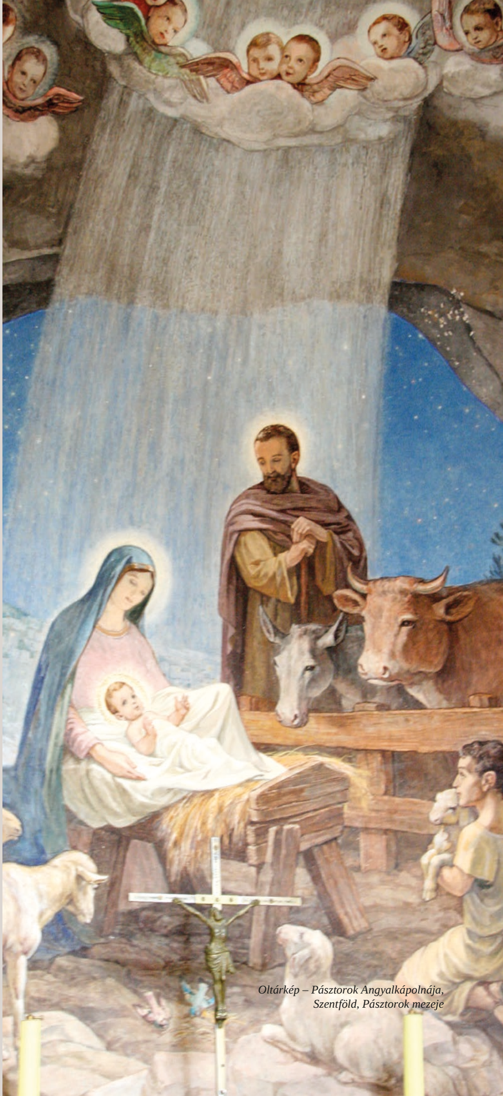
Oltárkép – Pásztorok Angyalkápolnája, Szentföld, Pásztorok mezeje