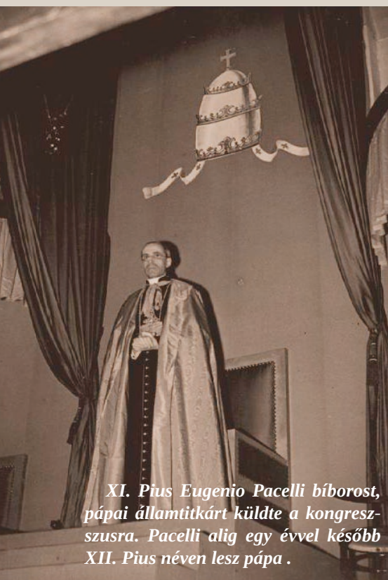
XI. Pius Eugenio Pacelli bíborost, pápai államtitkárt küldte a kongresszusra. Pacelli alig egy évvel később XII. Pius néven lesz pápa.

fel. Jobb oldalon pedig Pacelli bíboros és Horthy Miklós a feleségével foglaltak helyet. Ekkor rázendített az énekkar az „Ah, hol vagy, magyarok tündöklő csillaga...” kezdetű énekre. Ezzel egy időben megkezdődött a szentmise. A mise végeztével pedig minden ember ajkáról felcsendült a magyarok imádsága, a Himnusz. Az esemény végén a Szent Jobbot a koronaőrök kíséretében a városligeti Jáki