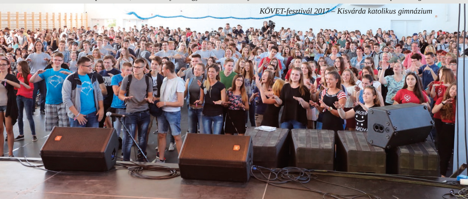
KÖVET-fesztivál 2017 – Kisvárdai katolikus gimnázium