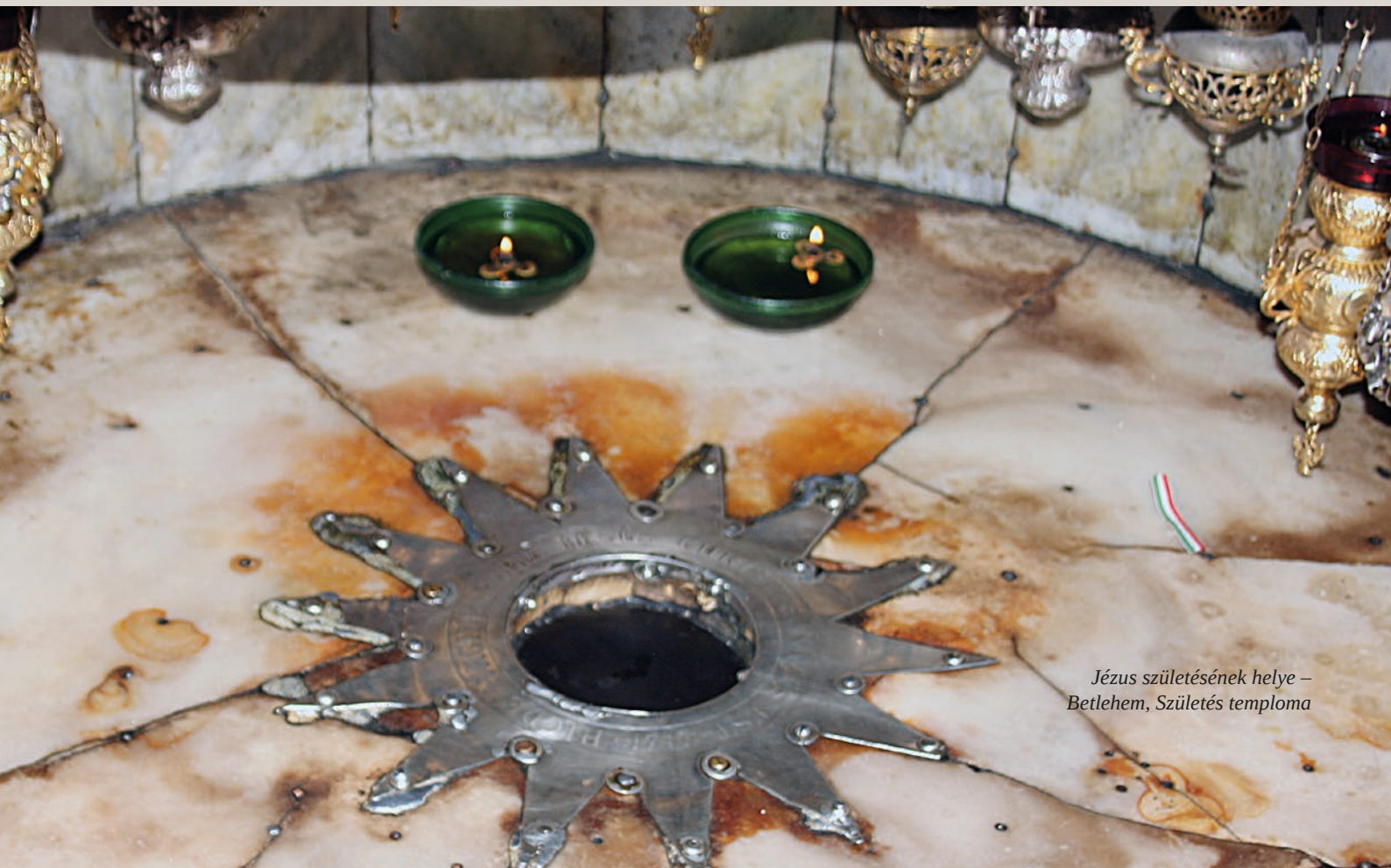
Jézus születésének helye – Betlehem, Születés temploma

tani akarja a család és a házasság szent voltát, meg akarja védeni az emberi személy és méltósága teljes igazságát.” Csak ennek az igazságnak fényénél lehetséges, hogy a család a nagy „kinyilatkoztatás” legyen, a másik első fölfedezése: először a házastársaké, majd a tőlük született gyermekeké. A mai ember ezt a modern hírközlő eszközökből nem képes megtanulni. A „szép szeretetet” elsősorban az imádságban tanulja az ember. Az imádsággal ugyanis mindig együtt jár – Szent Pál szavával élve – a Krisztussal együtt Istenben való benső elrejtőzés: „a ti életek már el van rejtve Krisztussal Istenben”. A Szentlélek, a szép szeretet forrása csak az ilyen elrejtettségben működik. Ő nemcsak Mária és József szívében ébresztette föl ezt a szeretetet, hanem minden olyan házaspár szívében is, akik készek meghallani Isten szavát és megtartani azt. Minden kis család jövője ettől a „szép szeretettől” függ; a házastársak, a szülők és a gyermekek s az összes nemzedékek kölcsönös szeretetétől függ.