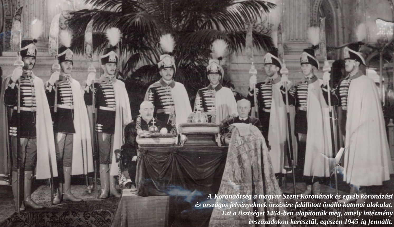
A Koronaőrseg a magyar Szent Koronának és egyéb koronázási és országos jelvényeknek őrzésére felállított önálló katonai alakulat. Ezt a tisztséget 1464-ben alapították meg, amely intézmény évszázadokon keresztül, egészen 1945-ig fennállt.