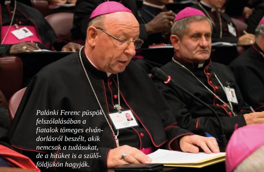
Palánki Ferenc püspök felszólalásában a fiatalok tömeges elvándorlásáról beszélt, akik nemcsak a tudásukat, de a hitüket is a szülőföldjükön hagyják.