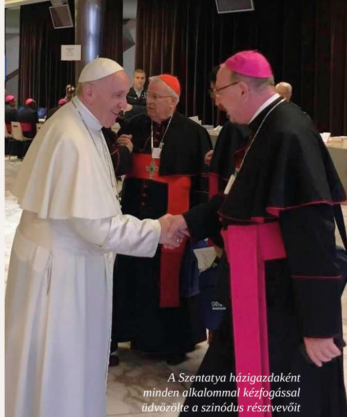
A Szentatya házigazdaként minden alkalommal kézfogással üdvözölte a szinódus résztvevőit

azt is hangsúlyozza, hogy a fiatalok ajándék időszak, de annak véget kell vetni, hogy helyet adjunk a felnőttkornak. Eljutnak-e a fiatalok erre a szintre? A helyes kísérés következménye, hogy a fiatalok meghozzák a maguk döntését. A kísérés fontos dolog, de veszélyes, ha nem úgy kísérjük őket, ahogy nekik jó, hanem ahogy ők kérik. Majd utalt Nagy Csaba egyházmegyes pap dolgozatára, amelyben a kísérés témában kifejti, hogyan fordult meg az emberek gondolkodása: „Oliver Rey már a hetvenes években látta azt a változást, hogy a szülők csak kísérőivé válnak gyermekeiknek. Amikor a babakocsi irányultsága 180 fokkal megváltozott, a gyermek most a külső világ felé néz, és már nem a szülő az, akit lát, aki előre tolja. Ez azt jelenti, hogy a nevelés és az élet elvesztette az összehasonlítás képességét, és nincs szilárd, biztos kapcsolat a szülők és a gyermekek között. Így lettek a szülők társaik és kísérőik a gyermekeiknek. A szülők mindent elfogadnak, amit a gyerek megtesz, anélkül, hogy képesek volnának visszautasítani vagy felelősségre vonni.