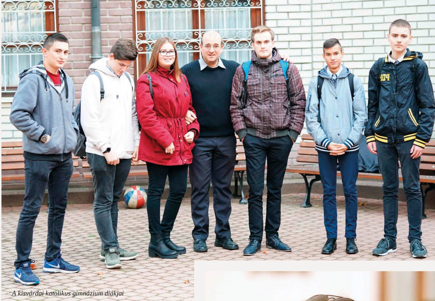
A kisvárdai katolikus gimnázium diákjai

mindent, és kérj egy tiszta és teljes szívet! Merniük kell mindent odaadni, hogy képek legyenek a hivatásuk elérésére.