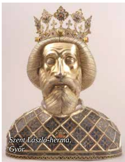
Szent László-herma, Győr

élte meg. Ezt igazolja az is, hogy koronáját, az uralkodás jelképét nem a fején viselte, hanem mindig maga előtt vitette. Az uralkodás szolgálatot jelent. Jézus Krisztus, az igazi király adott erre példát. Szent Lászlónak nem az uralkodásra volt szüksége, hanem szeretetre. Úgy uralkodott, hogy átengedte a hatalmat az igazi királynak, Istennek, így lett igazán keresztény. Nekünk sem uralkodnunk kell egymás fölött, hanem másokért élni. Felelősséget kell vállalnunk egymásért, nemzetünkért, magyarságunkért. Ehhez kérjük a nagy szent, országmegtartó királyunk közbenjárását, imádságát, segítségét.”