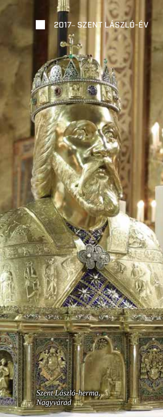
Szent László-herma, Nagyvárad

Szent László édesapja, Bajnok Béla, a megvakított Vazul fia; édesanyja II. Miesko, lengyel fejedelem lánya, Richeza hercegnő. Szent László 1046-ban született a Lengyel Királyságban; személyében biztosított az első, igazi testvéri kapcsolat a lengyel néppel – a vérségi kapcsolaton túlmenően a keresztény lélek és szellem kapcsolatát.