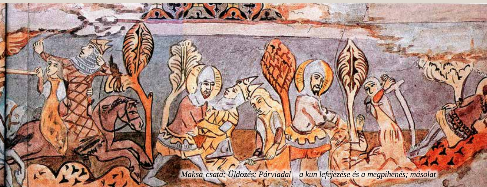
Maksa-csata; Üldözés; Párviadal – a kun lefejezése és a megpihenés; másolat

Fiú utóda nem lévén, öccsének, Gézának a fiait, Álmost és Kálmánt szerette és nevelte. Álmost hamarosan a horvát trónra ültette, Kálmán, aki a tudományokat és a könyveket szerette – s akiből, úgy hitték, pap lesz – igencsak vágyódott a trónra. Gyenge, vézna fizikuma is oka lehetett annak, hogy gyűlölettel fordult – az atléta természetű – nagybátyja felé. László szomorúan tapasztalta meg, hogy szemében mindig rideg elutasítást látott, holott hálát és szeretetet érdemelt volna.