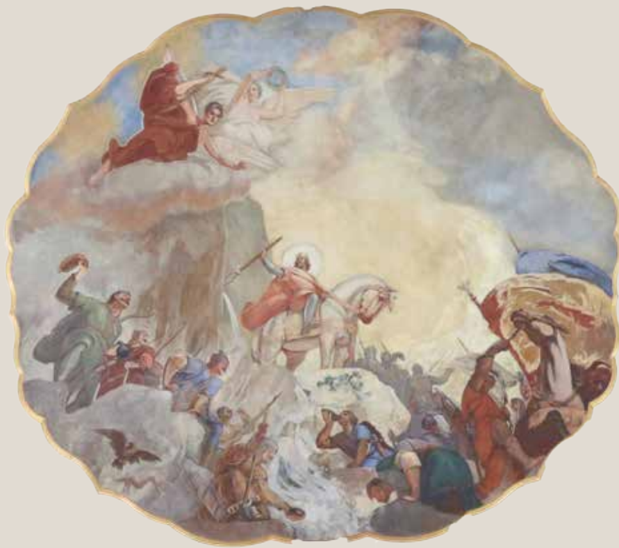
Szent László vizet fakaszt a sziklából (freskó) Debrecen, Szent Anna-székesegyház