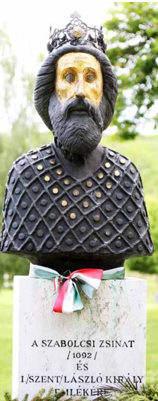
Szent László király mellszobra, amely a győri székesegyházban őrzött fejerekllyetartó (herma) mintájára készült. 1992-ben, a Szabolcsban tartott zsinat 900. évfordulóján állították a szabolcsi templomkertbe

A magyarság egyik legősibb településén, a Tisza-menti Szabolcsban 1092 májusában tartott egyházi tanácskozás, zsinat sok szempontból különleges gyűlés volt. Maga I. (Szent) László király (1077–1095) elnökölt rajta, és rendelkezései bekerültek az uralkodó törvénykönyvébe is.