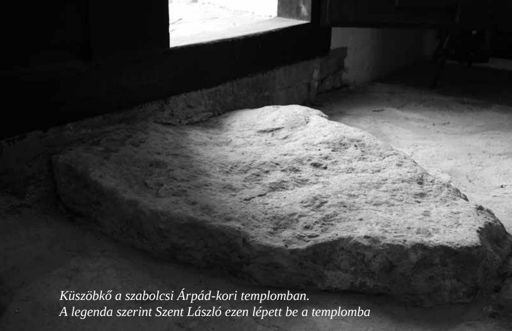
Küszöbök a szabolcsi Árpád-kori templomban. A legenda szerint Szent László ezen lépett be a templomba

A 9. rendelkezés a megkeresztelkedett, de ismét muszlimmá lett mohamedánokról szól, a 10. a zsidóknak tiltja meg, hogy keresztény nőt vegyenek feleségül vagy keresztény szolgálót tartsanak. A 11., 12., 15. és 16. határozat a vasárnap megszentelésével foglalkozik, így előírja a templomba járást, megtiltja a vadászatot és a munkát. A 26. pont a vasárnap nyugalmat a zsidók számára is előírja.