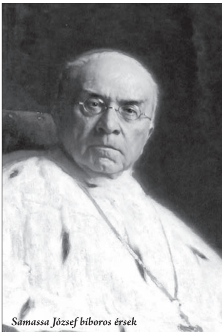
Samassa József bíboros érsek

énekelték. Maga a szentelési szertartás \frac{3}{4} 10-ig tartott. Eközben mintegy tízezres sokaság várt a bebocsátásra, majd 10 órakor megkezdődött az ünnepi szentmise. Az első szentmisét Párvay Sándor szepesi püspök mutatta be. Hatalmas ünneplés vette kezdetét. Főméltóságok köszöntötték az idős érseket nagyvo-