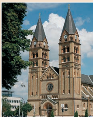
Megújulás után Nyíregyháza

értékesen tudjanak közreműködni a szeretet civilizációjának építésén nevednek dicséretére és dicsőségére. Krisztus, a mi Urunk által. Amen.