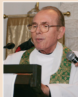
Gots atya visszatér Ausztriába