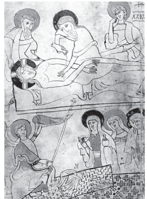
A rendszertelenül elhelyezkedő égési lyukak bizonyító erejük a Pray-kódex miniatúrájában

jól felismerhető a rajzon, valamint a rajta található rendszertelenül elhelyezkedő égési lyukak (bizonyító erejük pont a rendszertelenségükben rejlik), ami arra enged következtetni, hogy az már akkor megvolt, amikor a Pray-kódex készült. Ez a jellegzetes mintázat, mintegy újjelenyomatnak megfe-