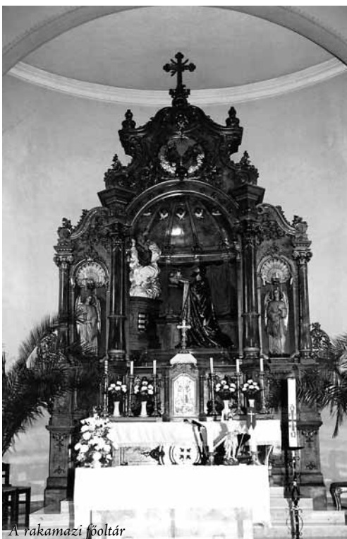
A rakamazi főoltár

Szombatonként az iskolai hittanon kívüli hitoktatás folyik az épületben a 3-8. osztályos gyermekek részére, hiszen fontos, hogy a gyermekek ne csak az iskolában és heti egy