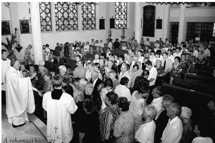
A rakamazi közösség