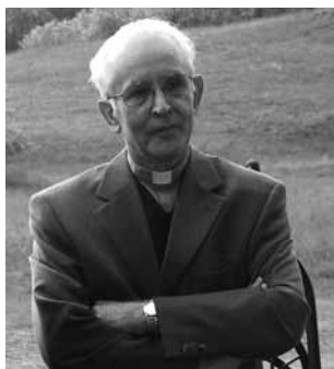
Bosák Nándor püspök

Bosák Nándor püspök atya tevékeny részese a püspökség hivatali életének. Mint az egyházmegye vezetője és pástora, felügyeli az egész egyházmegye lelkipásztori, kulturális, gazdasági életére vonatkozó döntéseket, nála futnak össze a szálak. Mindez rendszeres konzultációkkal jár az illetékes állami, gazdasági szervekkel, az egyházmegye papságával és híveivel, ami megkívánja, hogy ideje nagy részét irodájában töltse személyes