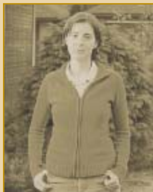
Betánia plébániai nővérközösség