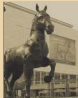
Az igazi Da Vinci Debrecenben