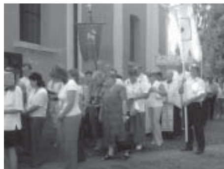
melyet a házigazda nyírkarásziak szíves vendéglátsással hálaáltak meg.