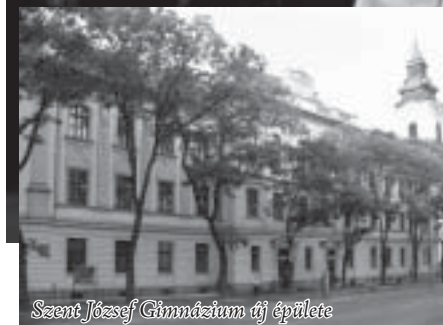
Szent József Gimnázium új épülete

vünkben, tartalékok az önzetlenségünkben, tartalékok az összetartásunkban, abban az összetartásban, ami összeköti katolikusokat a katolikusokkal, magyart a magyarokkal, embert az emberrel. Egyházi intézményeink megújulása az utóbbi években ennek az összetartásnak a tanúbizonysága. Tehát nem vagyunk egyedül. De nemcsak az anyagi források tekintetében, hanem a gondolatok, az elképzelések, a tervek tekintetében sem vagyunk egyedül.