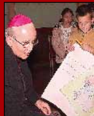
Az Eucharisztia sugara