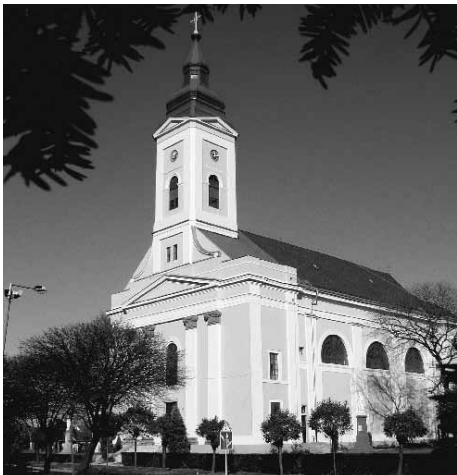
A polgári Nagyboldogasszony templom

A templom ablakaiból kiszűrődő fények és az orgona hangja jelzi a mise kezdetét. November hónapban úgynevezett Gergely-misé-