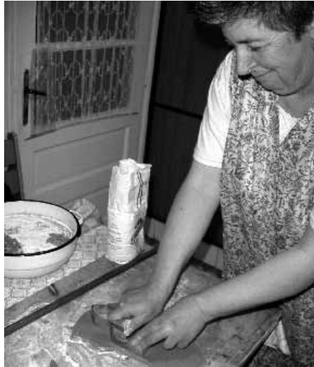
Egy héten keresztül áldozták idejüket az egyházközség tagjai.

kást indítottunk útnak „Kalács-misszió” néven, azzal a szándékkal, hogy minél több családnak eljuttassuk az egyházközségünk templomát szimbolizáló kalácsot, ezzel is erősítve azt az összetartozást, hogy mindnyájan része