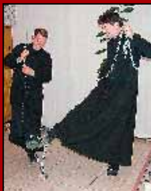
Fiatalok a világ életéért