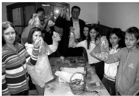
A gyerekek is besegítettek a munkába

vagyunk egy közösségnek, melynek központjában az egyház áll. A misszióban hittanosok, cserkészek, a rózsafűzér társulat és az egyház képviselő-testületének tagjai vettek részt.